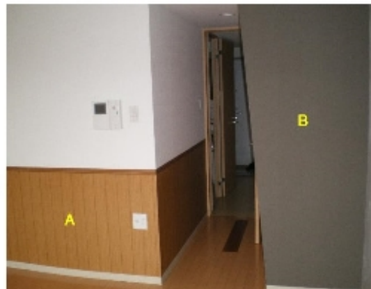
※ デザインクロスを使用したリフォーム例

右の写真の事例では、ペット飼育可能なマンションということもあり、Aポイントにペットが引っ掻いても破れにくい木目調のクロスを、Bポイントにアクセントカラーのモントーン調のクロスを使用して部屋に配色を施しております。